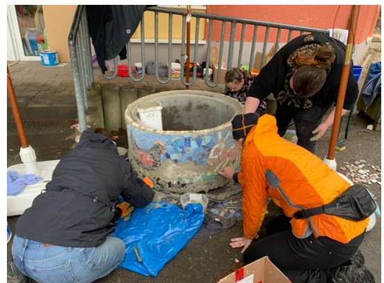
Im Regen wird am Blumenkübel vor der OGS weitergearbeitet.