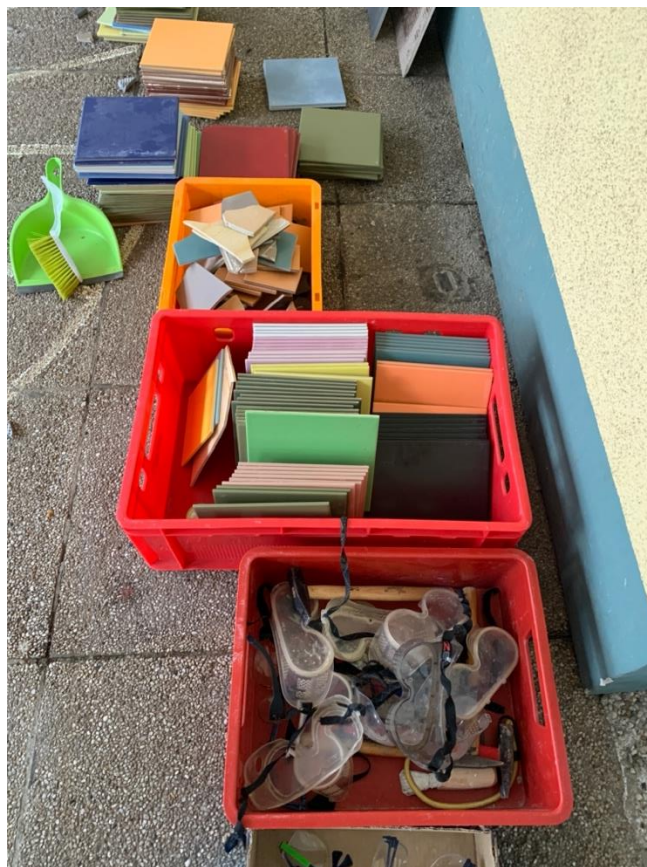
Werkzeug und Fliesen müssen hochgeschleppt werden.