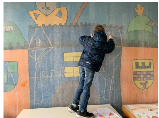
Die Kinder malen ihre Motive mit Kreide an die Wand.