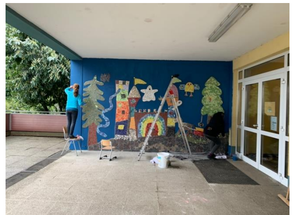
Fleißige Eltern verfugen das Mosaik und streichen die Wand.