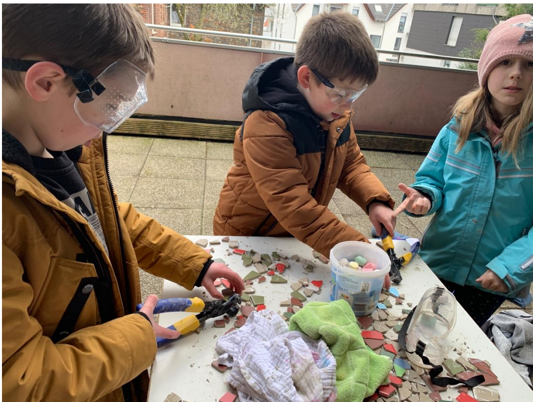
und scharfe Kanten werden abgeknipst.