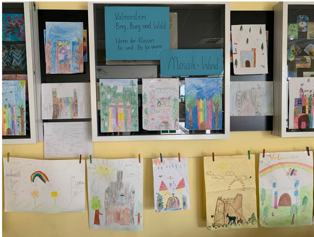
Entwürfe der Klassen 3a und 3b