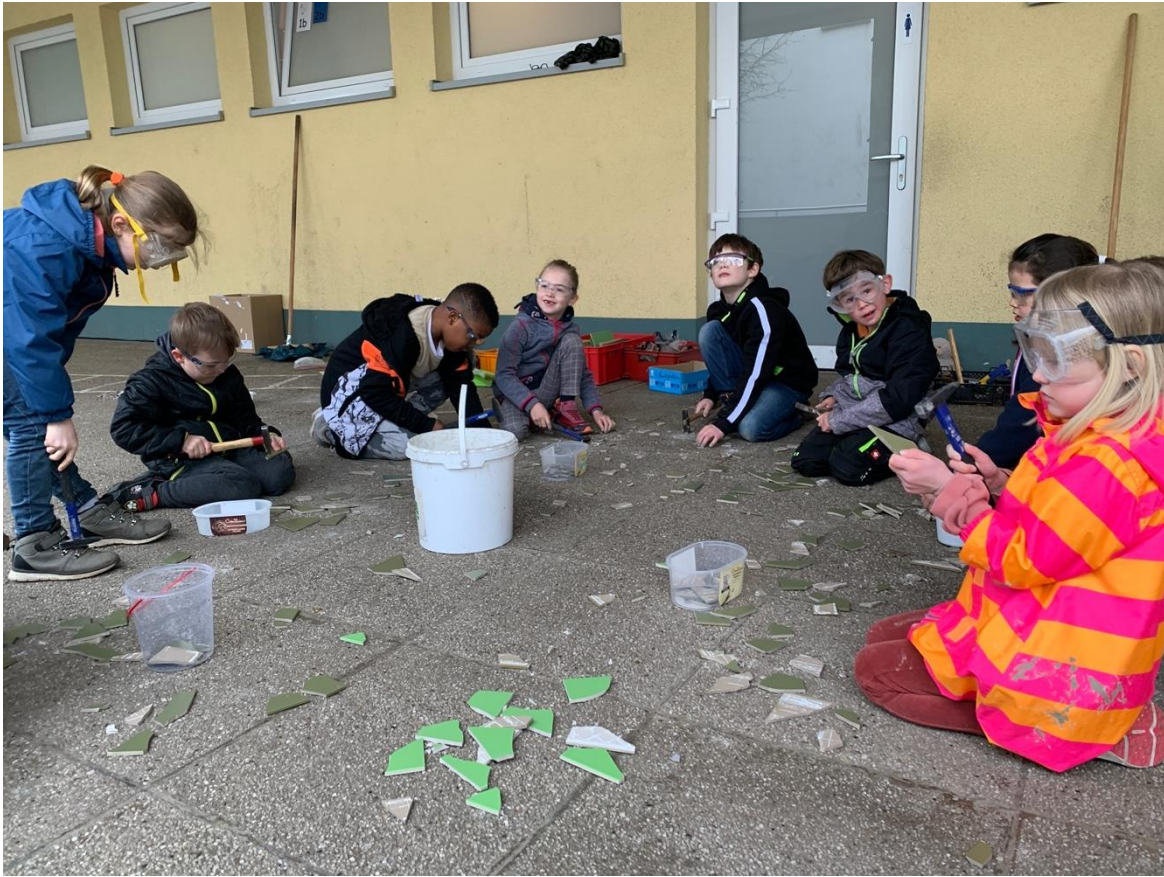
Fliesen werden mit Hammer und Schutzbrille zu Mosaiksteinen geschlagen