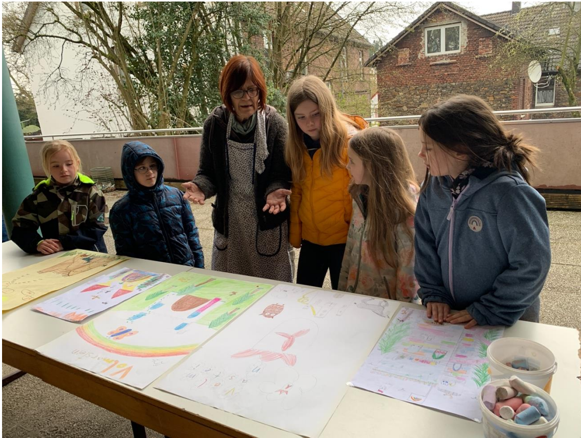
Die Kinder besprechen mit der Künstlerin, welche Motive sie auf die Wand malen.