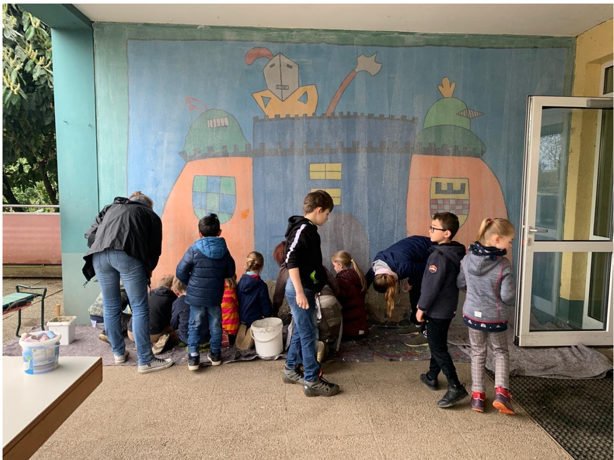
Die Wand vor der Verschönerung.

Die Wand in unserer Pausenhalle sollte verschönert und zu dem Thema „Volmarstein - Burg und Wald“ von den Kindern mit einem großen Wandmosaik neugestaltet werden.