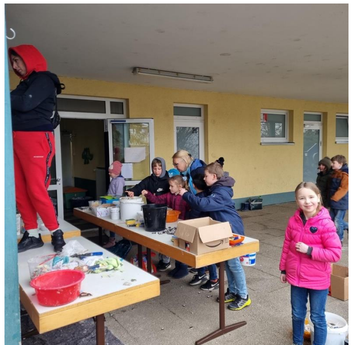
Es kann losgehen.